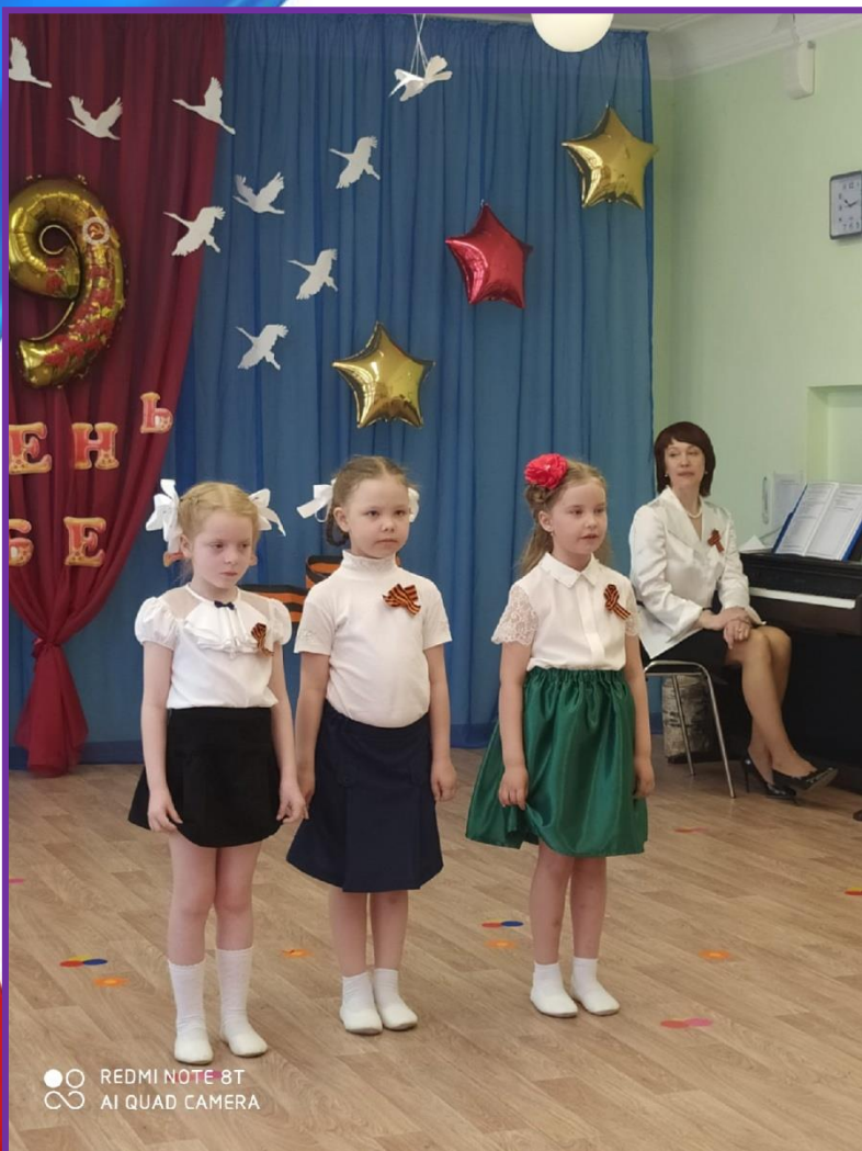
Литературный-музыкальный фестиваль «Наследники Победы»