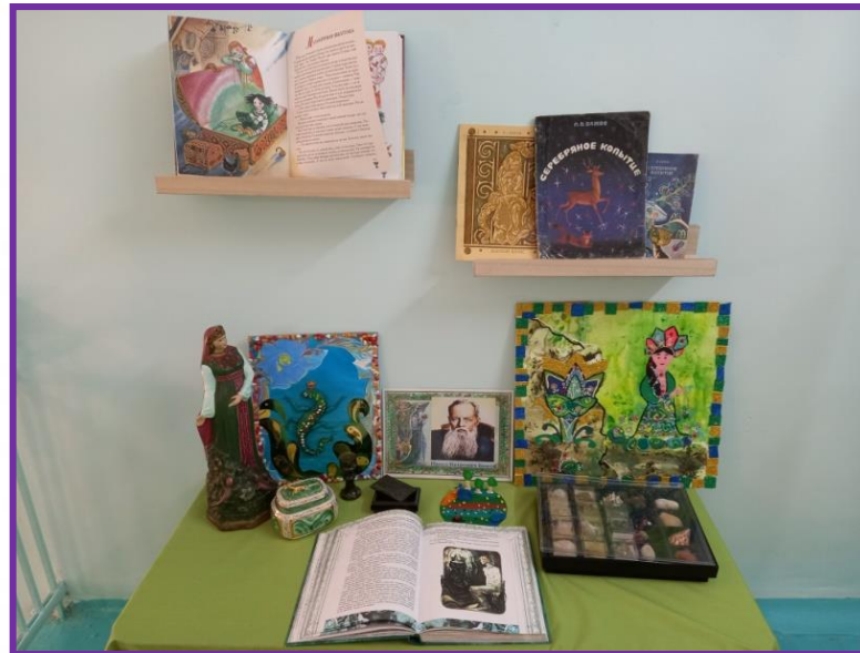
«Сказы П.П. Бажова»