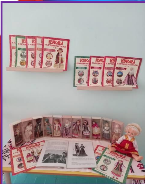
«Куклы в народных костюмах»