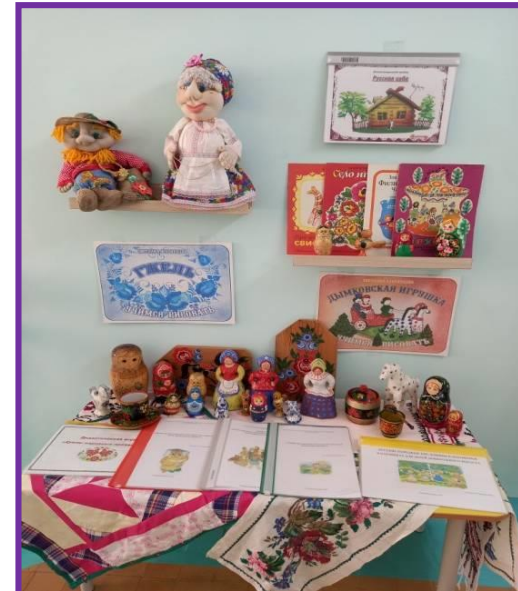
«По тропинкам народных традиций»