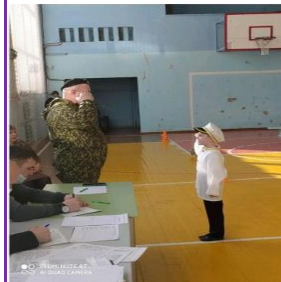
Спортивно-военизированная игра «Зарничка»